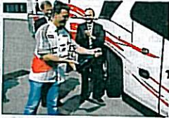
Schumi weiht Toyotas Starliner ein