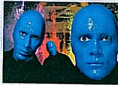
Stage-Highlight: Blue Man Group