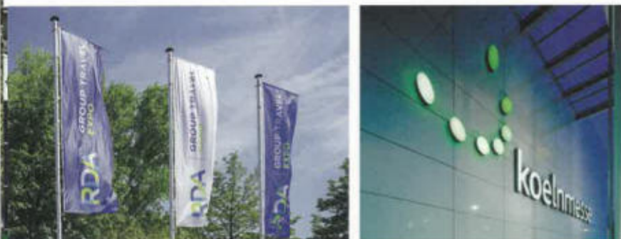
Der RDA und die Kölnmesse verständigen sich derzeit auf ein Hygienekonzept