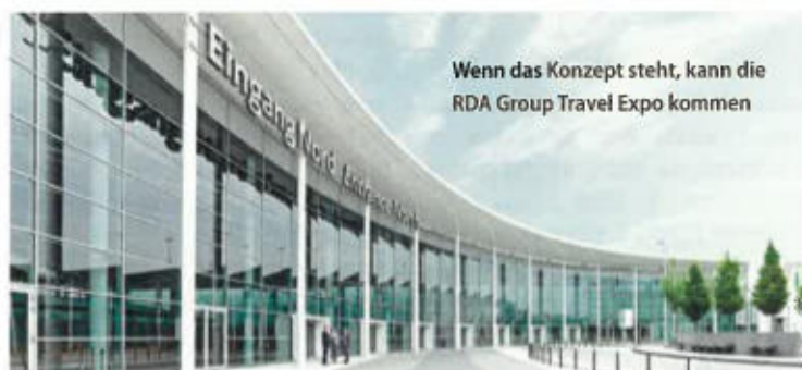
Wenn das Konzept steht, kann die RDA Group Travel Expo kommen

Workshop zur Herstellung von Tiramisu denkbar. Um den Blickwinkel zu wechseln und neue Angebote zu generieren, wird sich das