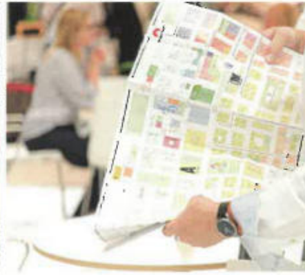
Die Aussteller, die die RDA Group Travel Expo 2020 besuchen, werden individuell auf die neue Situation reagieren müssen

ink tab hig lle orc han neu gej es j stal er a in rer